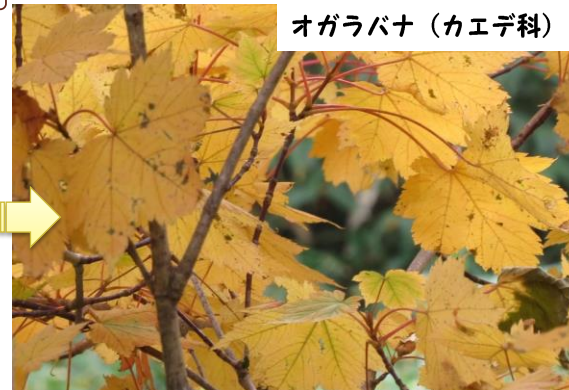
オガラバナ（カエデ科）