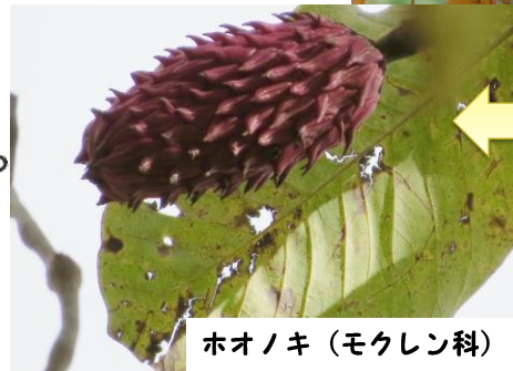
ホノノキ（モクレン科）

5～7片に浅く裂けた、手のひらのような形の葉は、黄色～黄味オレンジに黄葉し、手触りはしっとりとして気持ちいいので、見ついたら触ってみてください！